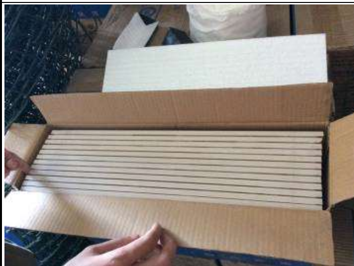
3. 68680B 30x45cm Blue