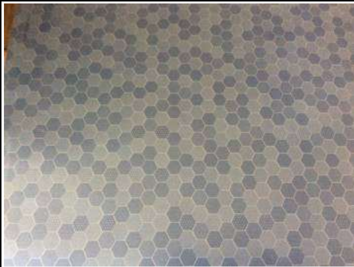
5. 68680B 30x45cm Blue