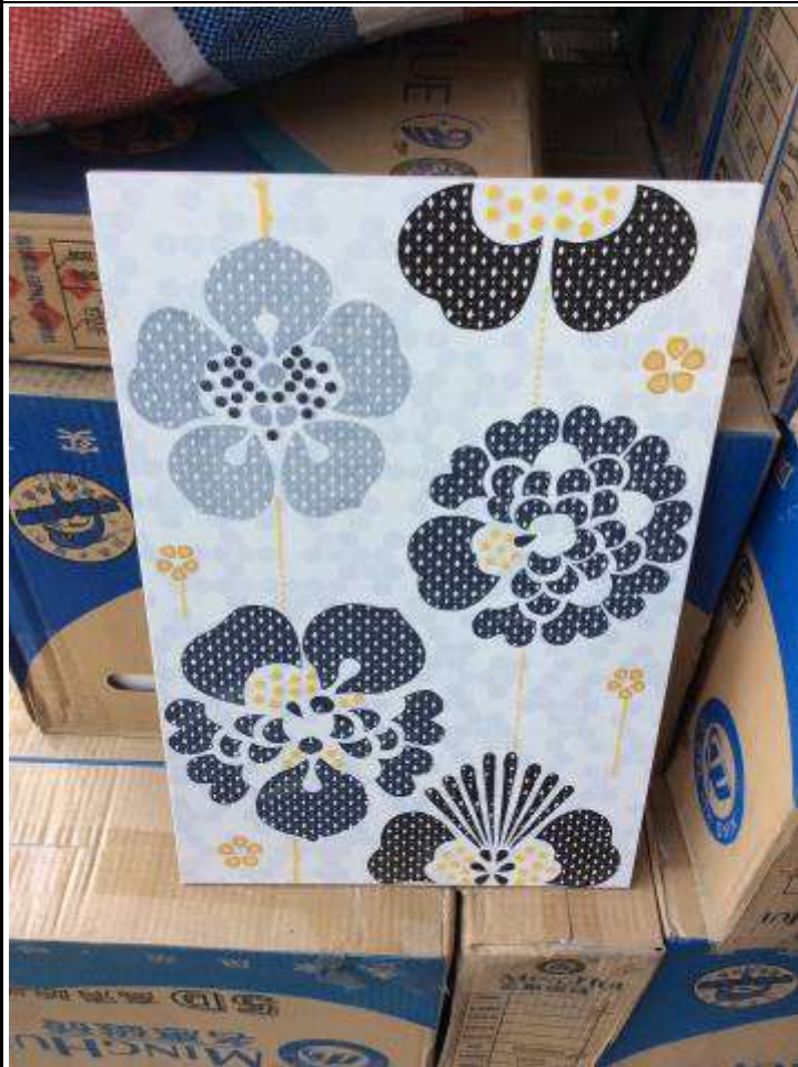
7. 68680 30x45cm White