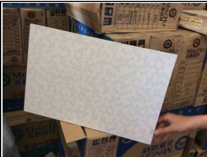
1. 68680 30x45cm White