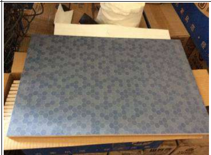
4. 68680B 30x45cm Blue