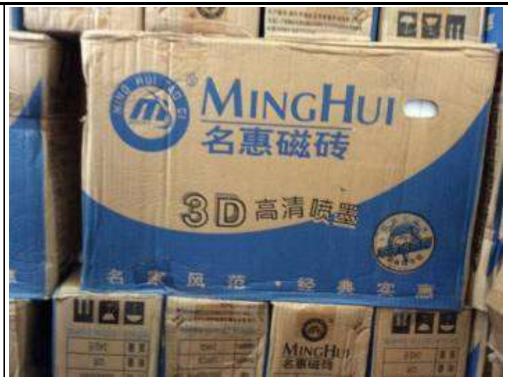
2. 68680B 30x45cm Blue